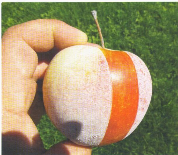
A DeccoShield egyenletes fehér bevonatot képez a termésen

dózisát a növényzet teljes felületéhez kell igazítani, ez a legtöbb zöldség-, gyümölcs- és szőlőművelés esetén 9-15 l között ingadozik hektáronként. A készítmény kijuttatását folyamatos keverés mellett javasoljuk!