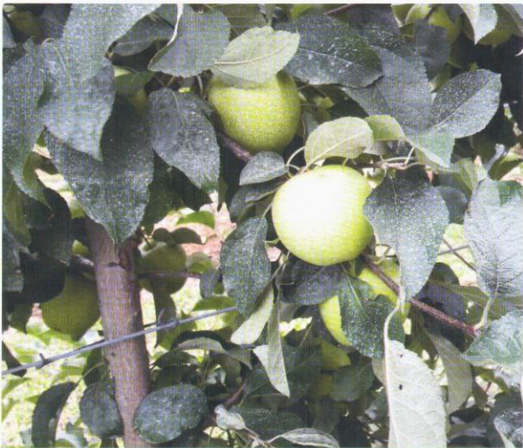
A DeccoShield kijuttatásával homogén, fátyolszerű bevonatot értünk el

„A tavalyi évben döntöttünk úgy, hogy az 5 ha-os Charden és Idared máskertünkben kiprobáljuk a DeccoShield nevű készítményt az ültetvény legnaposítottabb, 1 ha-os részében. A kijuttatás 14 l/ha dózissal történt, 600 l/ha vízmennyiséggel, önmagában, természetesen csapadékmentes időszakban, korán reggel, még a nagy meleg előtt. Örömmel tapasztaltuk, hogy száradás után „egfolyás mentes, homogén, fátyolszerű borítást sikerült elérnünk vele, aminek meg is volt a hatása. A kezelt táblában szinte csak elvéve tapasztaltunk napégéses tüneteket és azok kiterjedése is elhanyagolható volt, holott a többi 4 ha-os területen jelentős napkárokat szenvedtünk. Időközben többször is hullott csapadék, de a DeccoShield állta a sarat, így meg tudtuk őrizni a bevonatot egyszerű kezeléssel. Ez a fehér réteg a szedés és ládázás során teljesen eltűnt, külön tisztítást nem igényelt. Összességében nagyon elégedett vagyok a termékkel.”