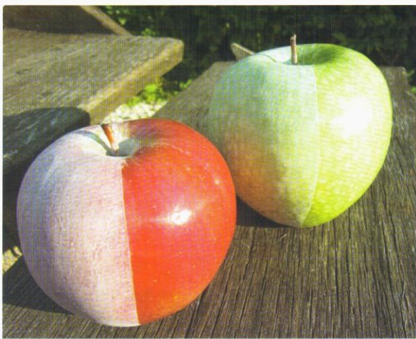
A DeccoShield hatékony védelmet biztosít a napégés és a hősokk ellen

Tavaly a Pinova fajta megelőző védelmére 2 alkalommal, 10 l/ha dózissal és 500 l/ha lé mennyiséggel juttattuk ki a készítményt, ügyelve az egyenletes felületi bevonat képzésére. Mivel a DeccoShield nagy fajsúlyú folyadék, fontos, hogy folyamatosan keverés mellett permetezzünk , a hajnali harmattól felszáradt felületre. A termék kijuttatása odafigyelést igényel ugyan, de problémamentesen megoldható.