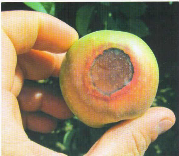
A napégés miatt bekövetkező terméskiesés jelentős anyagi kárt okozhat

A Malagrow Kft. a Dél-Európában piacvezető, magas hatóanyag-tartalmú DeccoShield nevű folyékony készítményt javasolja megoldásként, amely egy teljesen új megközelítéssel kezeli a fennálló problémát. A termék szub-mikrokristályos kalcium-karbonát szemcséket tartalmaz. Ez teszi lehetővé, hogy a beérkező direkt napfényből szórt fényt alkosson , így a túlhevülést és napégést okozó UV-, illetve infravörös tartomány energiáját jelentős mértékben csökkenti. A fény szórájának köszönhetően a fotoszintetikusan aktív, életet jelentő fény ugyanakkor majdnem teljes mértékben hasznosul, támogatva ezzel a növény életfolyamatait. Ennek a kettős hatásmechanizmusnak köszönhetően biztosítani tudjuk a növény folyamatos fejlődését, és jelentős mértékben (akár 5-6°C-kal is) tudjuk csökkenteni a növényzet és a termés hőmérsékletét.